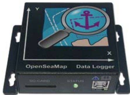
Hardware-Logger von OpenSeaMap

http://depth.openseamap.org/logger-bestellen