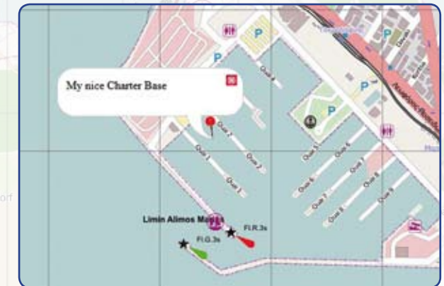
Ihre Werbung auf OpenSeaMap

http://openseamap.org/in-website-einbinden