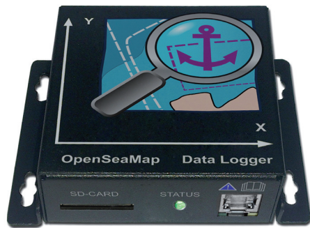
Hardware-Logger von OpenSeaMap

http://depth.openseamap.org/logger-bestellen